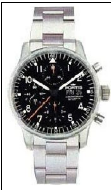
Fortis Pilot Professional Chronograph